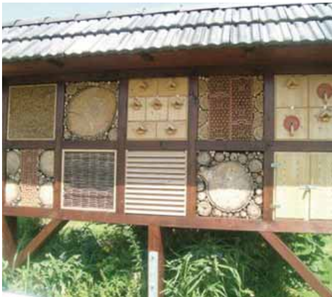
Insekten-Nistwand auf Streuobstwiese

0,5 % oder 18.000 Hektar der Landesfläche Nordrhein-Westfalens tragen Streuobstwiesen. Mit bis zu 3000 Tier- und Pflanzenarten zählen sie zu den artenreichsten Lebensräumen und haben eine große Bedeutung für die biologische Vielfalt unseres Bundeslandes.