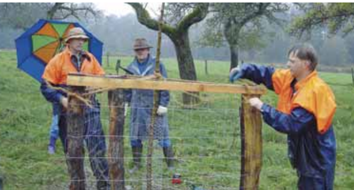
Verbisschutz mit einem Dreibock