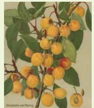
l.o.: Prinzessin Marianne, r.o.: Doppelte Phillipsbirne, m.l.: Alexander Lukas, m.r.: Gellerts Butterbirne, u.l.: Hauszwetschge, u.r.: Mirabelle von Nancy