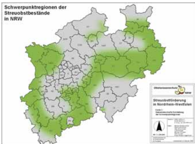
Der Streuobstgürtel von NRW zeigt die Schwerpunktregionen der Streuobstbestände des Landes

Der Streuobstbestand von NRW umfasste im Jahr 2005 mindestens 922.000 Hochstämme. Weitere Informationen und kreisweite Zahlen lassen sich den im Anhang angegebenen Internetadressen der Naturschutzverbände entnehmen.