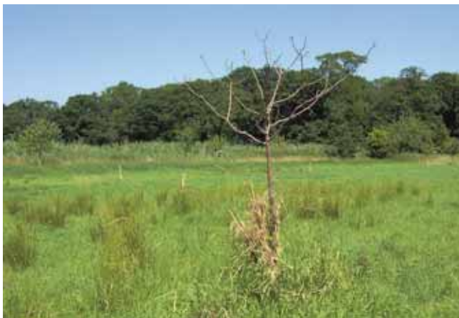
Die Binsensbulte auf dem Bild zeigen Staunässe an

Talböden, feuchte bis nasse Senken und überschwemmungsgefährdete Niederungen sind ungeeignete Standorte. Die Mängel werden oft durch auftretendes Binsenwachstum und verzögerten Grünlandaufwuchs angezeigt.