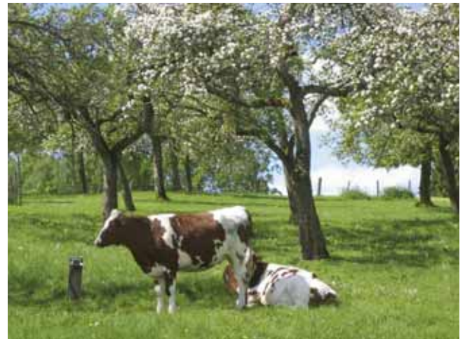
Eine extensive Beweidung ist mit Naturschutzziele gut zu vereinbaren