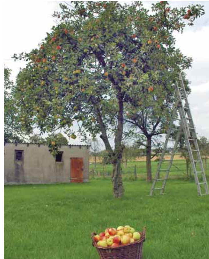
Für eine gute Ernte sind regelmäßige Schnittmaßnahmen notwendig

Der günstigste Zeitpunkt für umfangreichere Schnittmaßnahmen an älteren Kernobstbäumen ist der Spätwinter von Februar bis März. Keinesfalls wird bei strengem Frost geschnitten. In der Zeit von Juli bis August müssen diese Bäume kontrolliert werden und ergänzende, triebbremsende Schnittmaßnahmen zur Kronenkorrektur vorgenommen werden (Sommerschnitt). Stammaustriebe und Wasserschosse werden entfernt. Bei Pflaumen und Kirschen wird der Auslichtungs- und Verjüngungsschnitt schon im Sommer unmittelbar nach der Ernte durchgeführt.