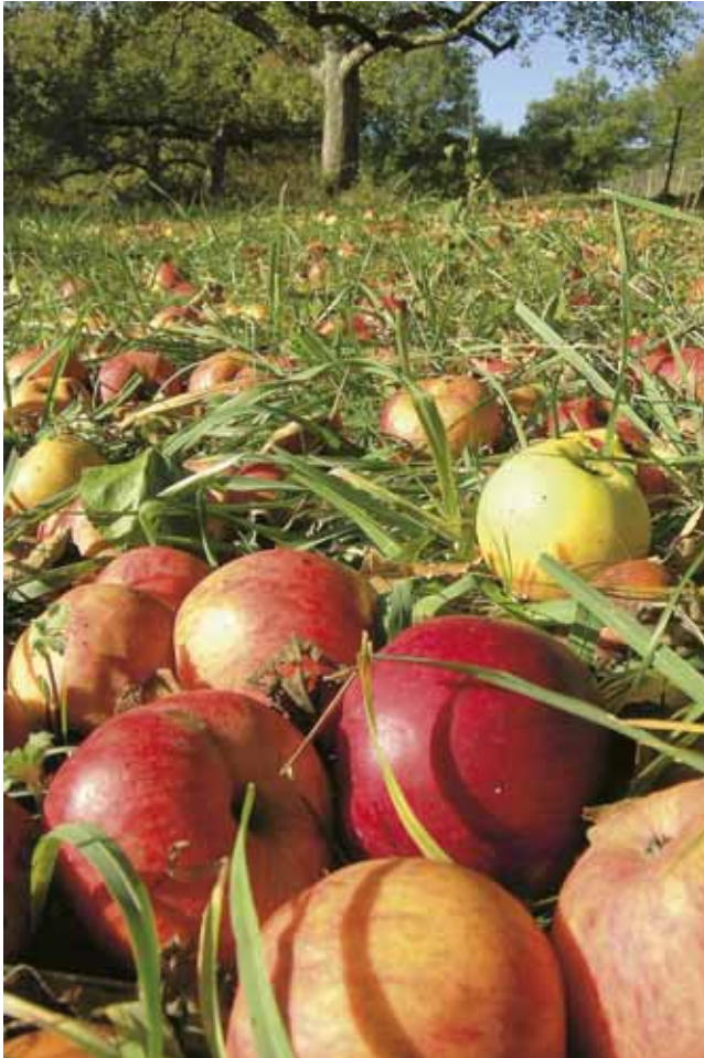
Falläpfel auf einer Streuobstwiese

Vor der Gehölzbeschaffung ist eine Abstimmung und Zusammenarbeit mit Nachbarn und anderen interessierten Grundstücksbesitzern, Naturschutzgruppen oder Heimatvereinen sinnvoll. Die Zusammenarbeit hilft Fehler zu vermeiden und Kosten zu sparen.