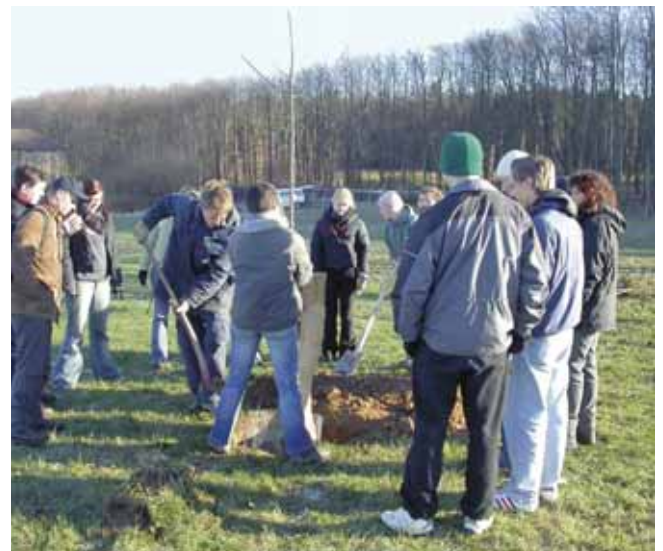
Eine sorgfältige, fachgerechte Pflanzung ist für Obstbäume wichtig

Frühjahrsplantungen in der frostfreien Zeit von März bis April leiden kaum unter Frostschäden. Dafür sind die im Frühjahr gepflanzten Bäume bei Trockenheit auf zusätzliche Bewässerung angewiesen.