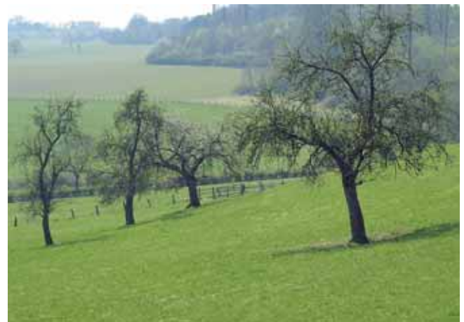
Hanglagen, an denen Kaltluft gut abfließen kann, sind für die Anlage von Streuobstwiesen geeignet

Obstbäume benötigen generell viel Licht und eine gute Durchlüftung des Bestandes. Fehlender Luftaustausch kann Pilzinfektionen wie Obstbaumkrebs begünstigen und verursachen. Beschattete Flächen sind daher für Obstwiesen ungeeignet, bei der Standortwahl ist ausreichend Abstand zum Waldrand zu halten.