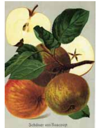
Im 19. und Anfang des 20. Jahrhunderts entstanden zahlreiche Obstsortenwerke, die in Bebilderung und kunstvoller Darstellung auch heute noch unübertroffen sind.

Nach dem 2. Weltkrieg ging die betriebswirtschaftliche Bedeutung der Streuobstwiesen zurück. Landwirtschaft und Obstbau wurden eigenständige Betriebszweige und der Obstbau konzentrierte sich in intensiv gepflegten Niederstamm-Plantagen.