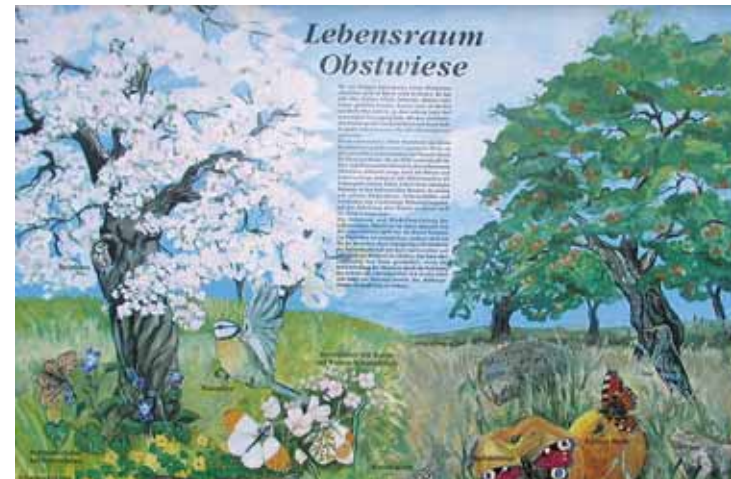
Struktur- und artenreicher Lebensraum: Die Streuobstwiese

„Die Baumzucht verschafft denjenigen, die sich damit bemühen, einen angenehmen Teil ihrer Nahrung. Sie gereicht zur Zierde eines Landes, zur Reinigung der Luft, zum Schutz und Schatten und hat überhaupt in vielen anderen Dingen ihren trefflichen Nutzen“ (Johann Kaspar Schiller, 1776)